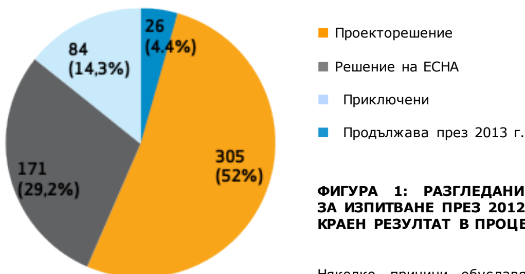
ФИГУРА 1: РАЗГЛЕДАНИ ПРЕДЛОЖЕНИЯ ЗА ИЗПИТВАНЕ ПРЕЗ 2012 Г. ПО ОСНОВЕН КРАЕН РЕЗУЛТАТ В ПРОЦЕНТИ

Към края на 2012 г. ЕСНА е приключила разглеждането на 560 предложения за изпитване, като е взела решение (171), съставила е проекторешение (305) или е приключила случая (84). Оценката на още 26 досиета продължава през 2013 г. (Фигура 1). Този брой включва 14 случая, в които идентичността на веществата трябва да бъде изяснена с помощта на органите по прилагане.